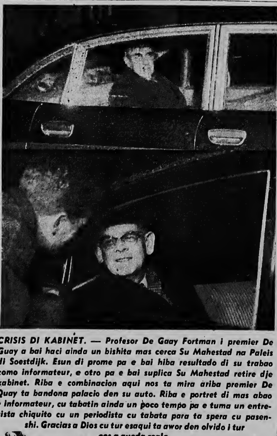
CRISIS DI KABINET. — Profesor De Gaay Fortman i premier De Quay a bai haci ainda un bishita mas cerca Su Mahestad na Paleis di Soestdijk. Esun di prome pa e bai hiba resultado di su trabao como informateur, e otro pa e bai suplica Su Mahestad retire dje kabinet. Riba e combinacion aqui nos ta mira ariba premier De Quay ta bandona palacio den su auto. Riba e portret di mas abao e informateur, cu tabatin ainda un poco tempo pa e tuma un entrevista chiquito cu un periodista cu tabata para ta spera cu pasenshi. Gracias a Dios cu tur esaki ta awor den olvido i tur cos a queda regla.

E bapor cu aerodromo "Wasp", cu tabata dirigi e esfuersonan di sublimentu, a bandona sitio dje accidente ajera noch, evidentemente convencido cu tur hende den e toren a muri. Pero bapornan di guardiacosta ta na e sitio ainda y duiker, kende su bapornan no a worde contesta, ta kere cu algun hende den e toren por ta for di conocimento.